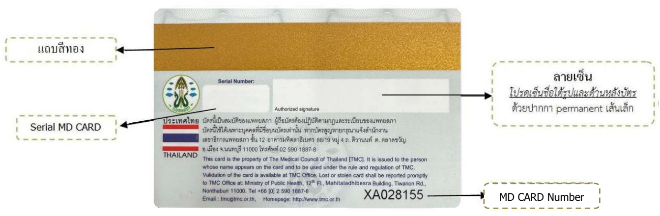
“ด้านหลังบัตรประจำตัวผู้ประกอบวิชาชีพเวชกรรมของแพทยสภา”